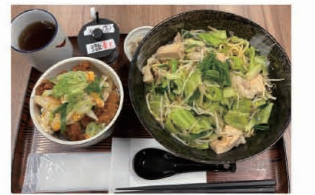
野菜たっぷりの「もつちゃんぼん」(900円) 写真は「もつちゃんぼんミニカツセット」(1,300円)