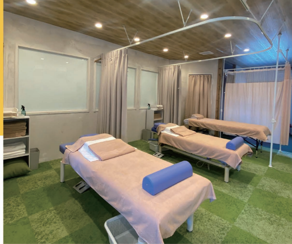
グリーンを基調としたスタイリッシュな院内