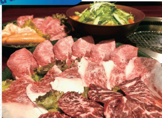
ミニ野菜サラダ、タン、カルビ、コウネ、ハラミ、ホルモン、ウインナーが付いたペアセット